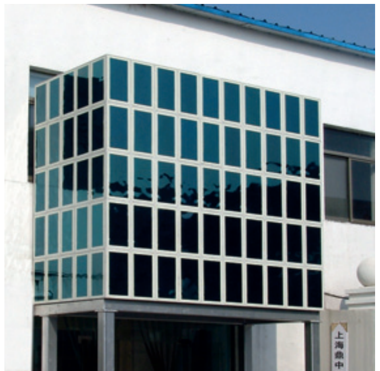
Testinstallation in Shanghai/China